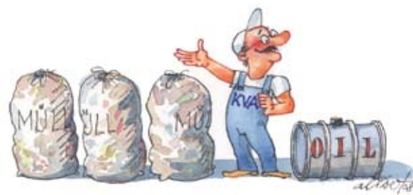
-drei Tonnen Abfall entsprechen dem Heizwert von einer Tonne Heizöl.

Die ERZ-Werke behandeln Kehricht rund um die Uhr während 365 Tagen des Jahres. Der Brennstoff Abfall geht dort nie aus, «was für die Produktion von umweltschonender Energie wichtig ist», wie die Anlagebetreiber unterstreichen. «Energie aus Abfall» ist auch ein vielversprechender Weg für die Auto- RESH-Verwertung. Das zeigen die Zahlen des Jahres 2007. Die schweizerischen KVA haben letztes Jahr aus gesamthaft 24'387 Tonnen RESH (davon 19'506 Tonnen Auto-RESH) 38'200 MWh Energie (Strom und Wärme) erzeugt. Wäre der RESH sämtlicher 230'000 (130'000 davon exportiert) im letzten Jahr ausser Betrieb gesetzter Altautos als Energiespender genutzt worden, hätten die rund 55'000 Tonnen RESH für hochgerechnet 200'000 MWh Energie gesorgt. Das reichte aus, um rund 6000 Haushalte (13'500 Einwohner) mit Strom und Wärme zu versorgen. Altautos würden so zur Energiequelle für Siedlungsräume wie beispielsweise Arbon (TG), Bülach (ZH), Burgdorf (BE), Davos (GR),